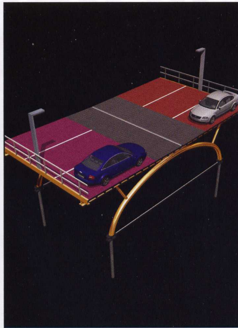
Bij de standaard 'parkeertafel' kunnen diverse accessoires worden aangeschaft.